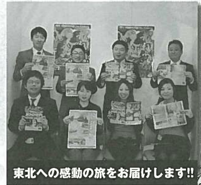
東北への感動の旅をお届けします!!