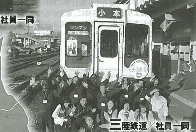
三陸鉄道 / 社員一同