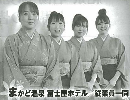
まかど温泉 富士屋ホテル / 従業員一同