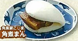
角煮家こじま 角煮まん