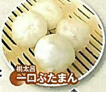
桃太郎 一口ぶたまん