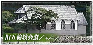
田五輪教会 / イメージ