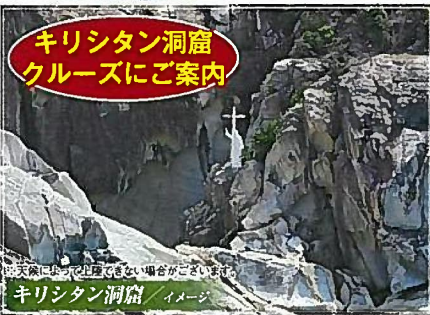
キリシタン洞窟クルーズのご案内