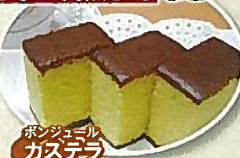
ボンジュール カステラ