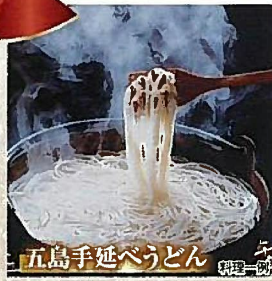
五島手延べうどん