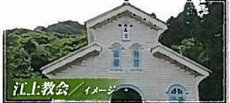
江上教会 / イメージ